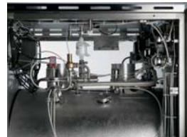
Modulating valve on steam inlet Modulares Ventil am Dampfeinlass