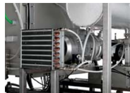
Condensate drain cooler and vacuum pump / Kondensatablaufkühler und Vakuumpumpe