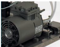
FVG & FVS - Air compressor FVG & FVS - Druckluftkompressor