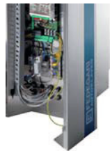
FVS - Stainless steel removable paneling FVS - Abnehmbare Edelstahlverkleidung