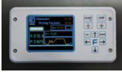
FVG & FVS - TSC 09 Microprocessor FVG & FVS - TSC 09 Mikroprozessor