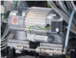
FVG - Vacuum pump FVG - Vakuumpumpe