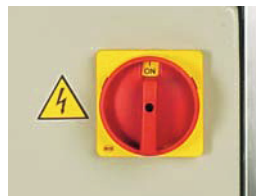
FVG - Main switch for emergency stop FVG - Notschalter