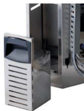
FVS - Front mounted condensate tank FVS - Vorne integrierter Abwassertank aus Edelstahl