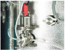
FVG - Membrane safety device for preventing lid opening even in case of minimal over pressure FVG - Membran-Sicherheitsvorrichtung verhindert Deckelöffnung bereits bei geringstem Überdruck